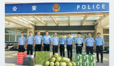
7月25日，安徽理工为濉溪县消防救援大队、溪河派出所送去清凉慰问。（通讯员 洪倩倩）