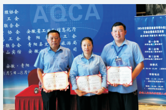
8月9日，安徽力普拉斯、安徽理工的三个QC小组分别荣获安徽省三等质量技术成果证书。（通讯员 洪倩倩）