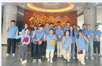
8月8日，国内营销部新一届大学生演讲比赛在肇庆理工圆满举行。（通讯员 王娇 梁剑鸿）