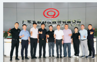
8月5日，理工国际与广东JL智慧能源有限公司达成战略合作。（通讯员 何永权）