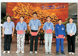
日前，肇庆理工与安徽理工举行员工爱心基金派发仪式。（通讯员 陈蕾 洪倩倩）